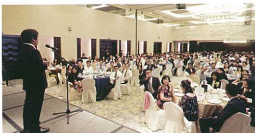
會場上坐滿了各國的參加者