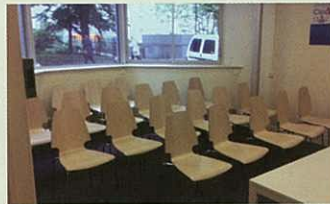
簡約設計的會議室