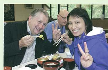
靈活地使用木筷品嚐便當 (奈良縣・春日大社)