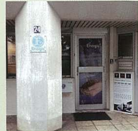
大廈的地面辦公室入口