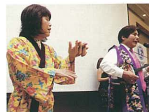
完結時大城會長夫婦用三味線跟四竹樂器演奏，並唱出「福壽之歌」。