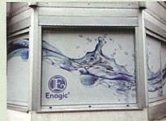
周圍富藝術感的設計

在法國的巴黎分店終於開幕了。正因為巴黎在歐洲的中心地帶，Enagic 事業在歐洲也很快活躍起來吧。