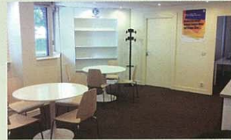
靜候大家到來的接待室