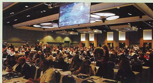
坐無虛席的酒店會場