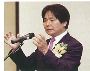
解釋開設支店意義的大城會長

在熱烈的儀式之後，大城會長夫婦表演了三味線跟四竹樂器演奏，並用「福壽之歌」來完結整個派對。