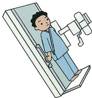
不是西方醫學才是醫學

Ayurveda，亞拉伯的醫學，西藏的醫學，非洲的醫學等。正是因為各地不同的背景而有著不同的差異。