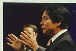
訴求著實現真正 健康的大城會長

而大城博成會長也作為嘉賓出席了研討會，叫出「讓還原水的普及更進一步一起加油吧！」，而大家則用熱烈的掌聲回應。