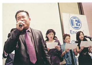
改編自當地樂曲的「Kangen-Song」由"混聲"合唱團熱唱中