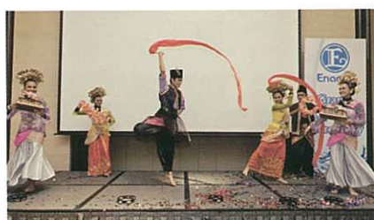
馬來西亞傳統的歡迎之舞