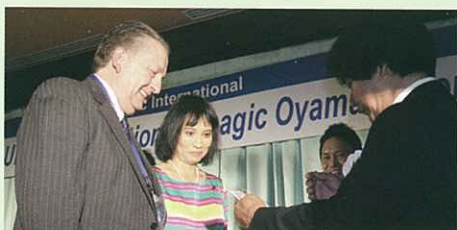
(所有照片都是在3月訪日時所拍) 會議上接受大城會長表揚

They expressed their gratitude to CEO Oshiro and closed the interview by saying, "We invite you to join the Enagic family and to help people. Help us spread the word about Kangen Water worldwide."