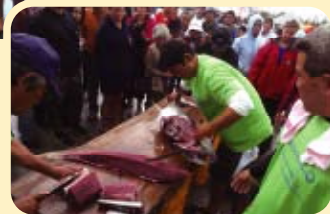
大受歡迎的鮪魚解剖示範