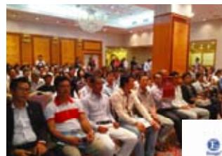
10月27日在金邊舉辦的演講會