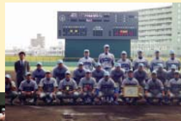
與優勝獎杯跟表揚狀一起的記念合照