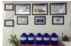
貼在牆上的各種資料