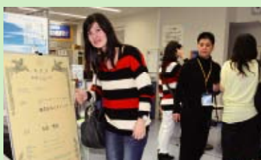
3月訪日時在牧港會客室參觀

Once she realized the greatness of Kangen Water, her business shifted into high gear and in just a little over a year, she successfully achieved the title of 6A. "Make them love the water, then they will look for the machine", she says. Now she is travelling on a mission so that "All Indonesians can drink Kangen Water."