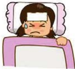
由於很大溫差的關係...

其實最危險是由於很大溫差所引致。當氣溫越低時，溫差的分別便會越高，即生病的危險便會加大。當溫差增加的時候，同時間腦中風跟心肌梗塞的風險也相應提高。