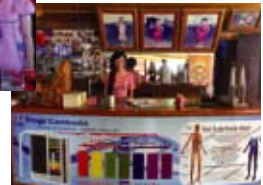
店內放置了說明展板