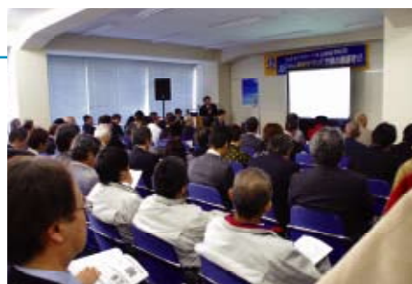
超滿座的東京展示會場

而且在「食品衛生上使用殺菌電解水的活用方法」、「擴展電解水的用途」、「JEWA的