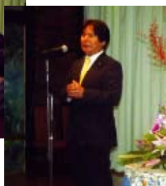
正激勵各參加者的大城會長