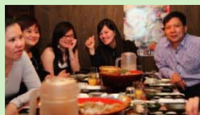
跟好友在京都享用晚餐