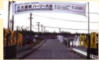
エナジックが主催したハーリー大会