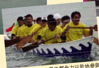
Enagic員工都全力以赴地參與