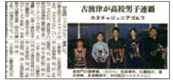
「沖繩 Time」11月6日刊載了比賽結果