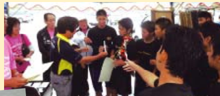
大城會長向優勝隊伍贈予獎杯