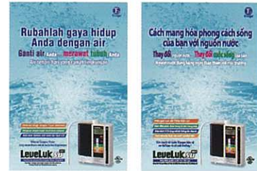
印尼語(左)跟越南語的說明單張

於躍進中的亞洲當中，擁有2.4億人口的印尼跟9千萬人的越南同樣也相當突出。Enagic 事業在當地也順利地不斷擴大，而很快印尼也會開設分店。所以香港分店特別以當地語言印製了在演講會等擔當了很重要角色的還原水機介紹單張。現在當地的分銷商也可以以此為「武器」，在當地推廣還原水了。