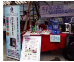
設置了還原水機的櫃台