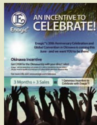
正在世界各地實施中的比賽

了26日以後，便會到大阪工場參觀，京都、奈良等地觀光，詳情請向各分店或6A分銷商聯絡。