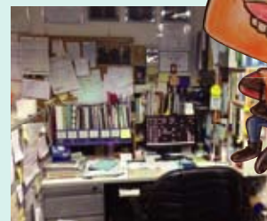
His Kangen shop filled with business material 放滿資料的還原水店 資料に囲まれた還元ショップ