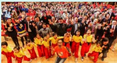
Training the members at a “Super Laughter Club” meeting 「超級愛笑俱樂部」的集會上指導歡笑 「超級愛笑俱樂部」の集いで笑いを指導