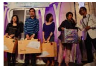
在抽獎中得獎者都很高興