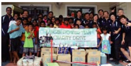
接受訪問的小朋友們