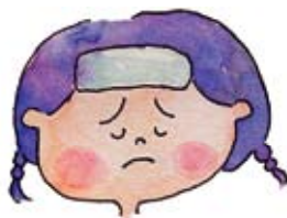
「虛的狀態」為典型症狀