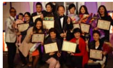
頒授小組領袖證明書的各人