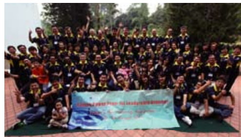
一眾Kangen Power Team