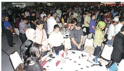
Observing a moment of silence for those who died in the WWII Battle of Okinawa. (Memorial Day, June 23rd)