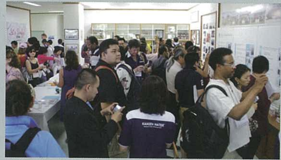
Participants learn about history of Enagic in the exhibition room. 展示室內展示了Enagic的歷史