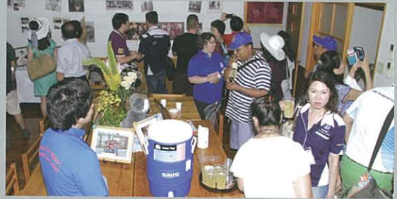
Viewers admiring the roots of "Mr. O" 正在參觀「大城會長出身地」的參加者