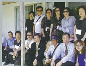
Team Taiwan. 台灣團隊之各位