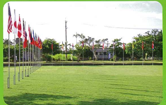
At the convention, flags from 27 countries fluttered in the clear blue sky. 在會場四周豎立的 27 國國旗