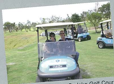
Participants touring the Sedake Golf Course in golf carts. 坐進高爾夫球車參觀高爾夫球場的參加者