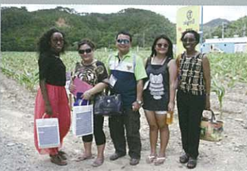
Taking pictures in front of the Ukon Valley. 在薑黃村前拍照留念