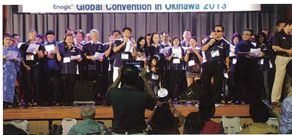
Team Malaysia singing the “Kangen Power Team Song” 馬來西亞Gary小組在台上唱出「Kangen Power Team Song」!