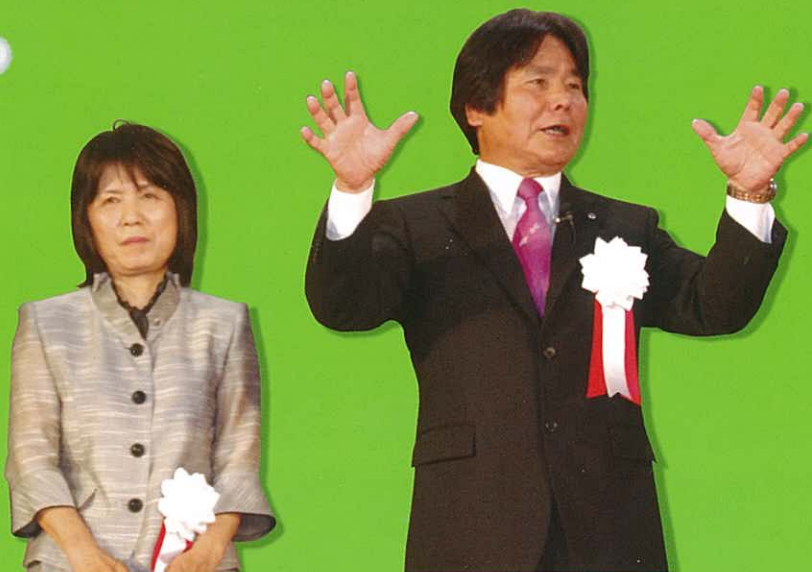
Mr. & Mrs. Ohshiro greeting and inspiring attendees at the Convention. 向參加者致意歡迎的大城會長伉儷

This summer, 500 top distributors from 27 countries gathered in Okinawa for the Global Convention!