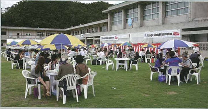
Hungry participants enjoying lunch around tables on the lawn. 大家在草地上進食午餐