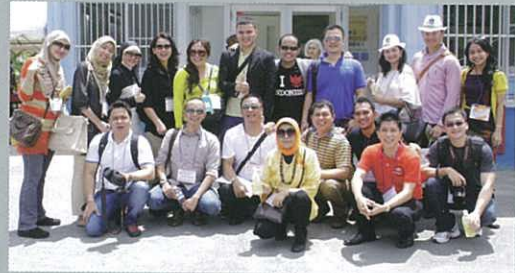
Team Indonesia visiting the Ukon factory. 印尼團隊參觀了薑黃工場