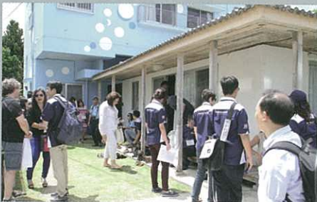
Many distributors visit the "Home in Sedake" 大量參加者到了「瀨嵩之里」參觀