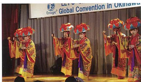
The bewitching Ryukyuu dancers. 美妙之琉球舞蹈