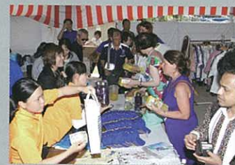
The busy gift shop. 販賣部充滿了參加者