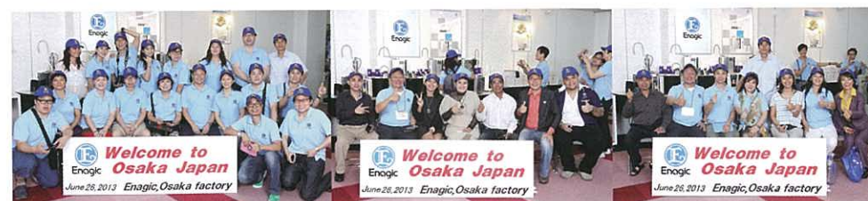
香港及其他國家團隊