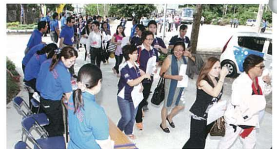
Excited participants going through the front desk and into the convention area. 各參加者不斷的通過接待處