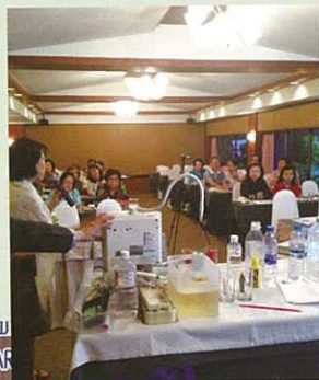
會場有很多女士出席