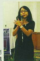
頂級分銷商 Wesmira小姐的演講