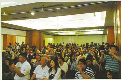
由於坐位不足而要站著看的參加者

說明。在會議完結後，一眾於附近的餐廳內慶祝在4月後達成之新6A。而各新6A也誓言於今後也會繼續全力以赴。