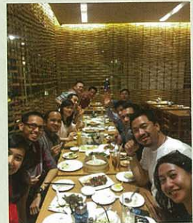
慶祝升級成為6A的各位