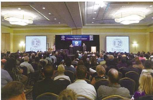
The venue was completely full of guests. 酒店內的會場超滿坐