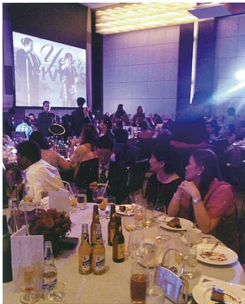
Many distributors and guests gathered for the ceremony. 會場齊集了分銷商及嘉賓