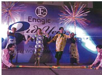
The traditional Philippine bamboo dance. 菲律賓傳統的竹舞

The attendees enjoyed the entertainment. 參加者享受著余興時間