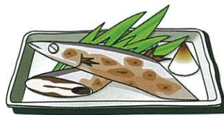
當季之食物只限當季

為此，就算當9月到來時把窗戶關上，令室內溫度升高，然後打開冷氣，飲食也同樣地，手裏拿著凍飲，吃著冰凍的食物。