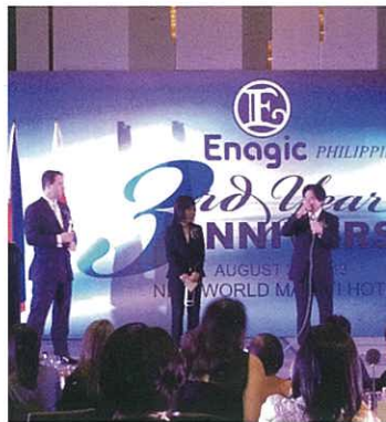
Mr. & Mrs. Ohsiro greeting and inspiring attendees at the celebration. 大城會長伉儷向參加者作出激勵