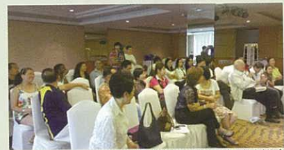
於寬敞的會場內舉行的演講會