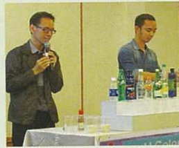
受到注目的「水之實驗」