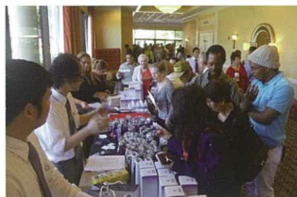
Enagic products were a bit hit! Enagic產品非常熱賣！