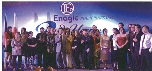
Active distributors on stage put attendees in high spirits. 台上的頂級分銷商向各參加者鼓舞作為終結

Enagic Philippines Inc. 21st Floor, 6788 Ayala Avenue, Oledan Square, Makati City Philippines TEL.632-519-5508 FAX.632-519-1923