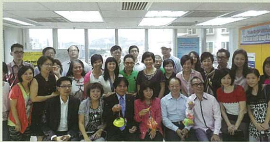
許多人前來祝賀開幕