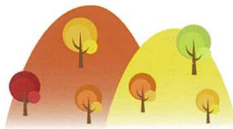
必看！秋季的健康護理

當中「七情」的影響如下。過度生氣影響肝臟，過度高興和驚嚇影響心臟，過度顧慮和思想過