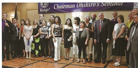
盡心盡力地舉行特別研討會的當地分銷商