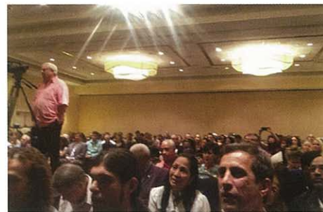
聚集在酒店的人們