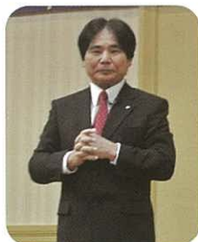
熱忱地講述Enagic理念的大城會長