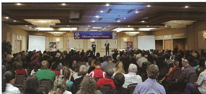
超爆滿的德克薩斯會場