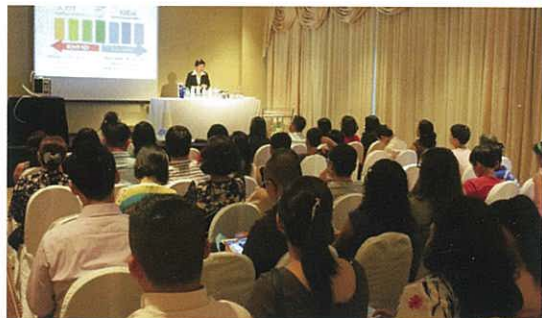
被參加者淹沒的胡志明市會場