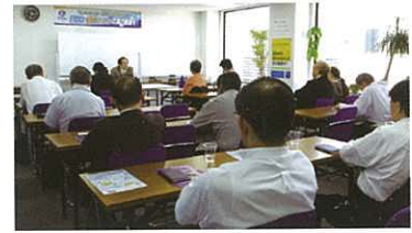
展開熱烈討論的大阪會議

從9月份開始的新登錄者，除了頭款外，分期付款的款項均可以在便利店辦理匯款。詳情請到各個分店洽詢。