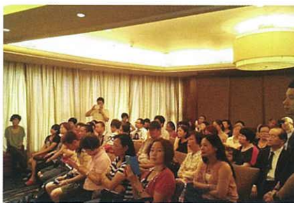
認真聽著講師談話的參加者(河內會場)