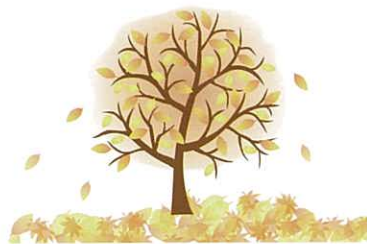
為迎接冬季必須好好準備！

像熊等的冬眠動物，為了渡過寒冬，秋季時會大量進食令身體體積膨脹。特別是在晚秋時的現在，牠們會把握最後機會，盡量攝取身邊的食物。