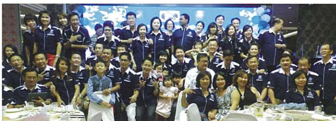
Taking a commemorative photo after the Ceremony. 完結後拍攝紀念照