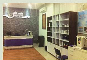
準備了大量相關產品