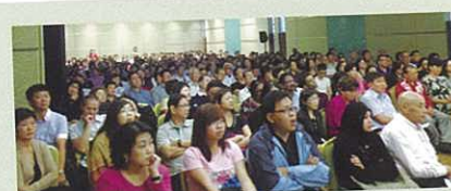
Many people also packed the Ukon Seminar held in the same Hotel on the 13 th . 於13日同一酒店內舉行的薑黃演講會也全場爆滿