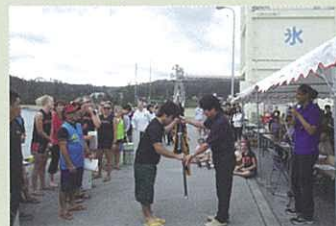
優勝組由大城會長手中接過優勝旗