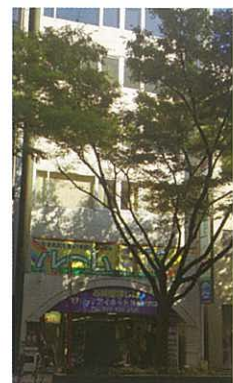
博多站旁的辦公室