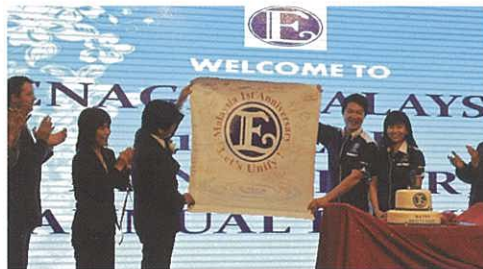
The 1st Anniversary pennant hung up on the platform. 台上展出1週年錦旗