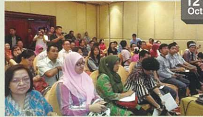
The venue in Jakarta. 耶加達會場