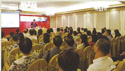
The venue was jam-packed with participants. 於酒店會場內的一眾參加者