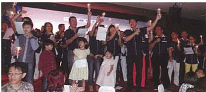
Team Malaysia singing the "Kangen Power Team Song" 馬來西亞團隊唱出「Kangen Power Team Song」