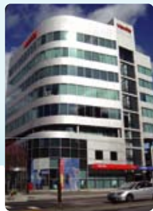
⑧ Vancouver (溫哥華)