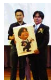
One distributor, who is also an illustrator, gave Mr. Ohshiro a portrait. 其中一名分銷商送上親手繪製的大城會長「畫像」