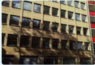
12 Germany (德國)