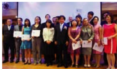
6A (and above) distributors all lined up. 6A及以上之分銷商排成一隊