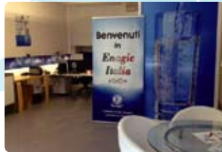
13 Italy (意大利)