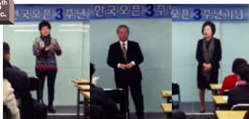
One after another, leading distributors said a few words to the audience. 頂級分銷商一個接一個地向大家問好