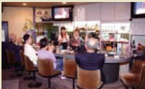
大阪府茨木市庄2-19-18 川崎スターカメラ2F 電話：072-624-4308

●營業時間：午後12時30分～午後5時跟午後6時～午前0時兩段制 (逢公眾假期休息)