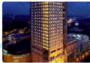
19 Malaysia (馬來西亞)