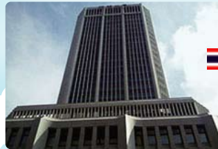
18 Singapore (星加坡)