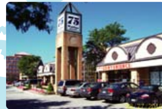
⑨ Toronto (多倫多)