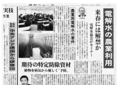
「農村新聞」差不多以全版作出報導

11 月 15 日於東京之會場內由 JEWA(日本電解水協會) 舉行之電解水演講會,以特集型式刊載於「農業新報」(11 月 25 日) 跟「農村新聞」(11 月 25 日)。兩份報張也報導了農水省已將酸性電解水認為「特定防除資材」,並把電解水於農業方面應用上作出了廣泛報導。