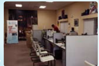
⑥ Florida (佛羅里達)