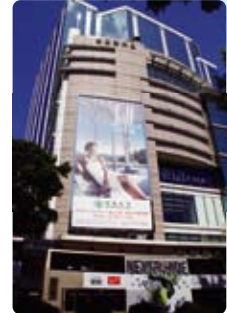
24 Hong Kong (香港)