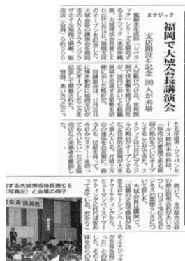
以 7 段篇幅報導於「日本流通產業新聞」

11 月 18 日於福岡市內之酒店舉行,福岡分店開設記念「大城會長演講會」之情況,於「日本流通產業新聞」(12 月 5 日) 得到了包括照片之報導。在報導福岡分店開設之同時,於同版也得到了「在世界展開不斷快速進擊的同時,也於國內明確地展示了加速展開組織」的評價。