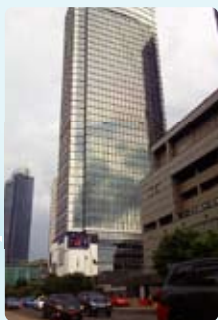
⑫ Indonesia (印尼)