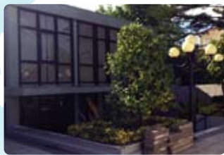
16 Portugal (葡萄牙)