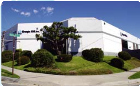
① Los Angeles (洛杉磯)