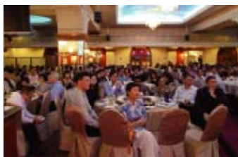
500 people thronged the restaurant. 會場之上有500人出席