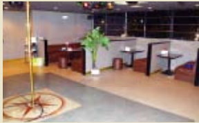
石川県金沢市片町2-22-1 犀虹ビル7F 076-261-4877