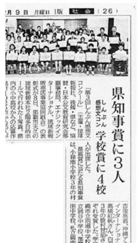
報導了頒獎儀式的「琉球新報」

在 1025 篇投稿作品中選取了 35 人共 4 所學校得到獎賞, 敝社向全體得獎者提供了薑黃茶, Enagic 月曆, 以及天然溫泉 Aroma 之入場券, 眾人也很高興。