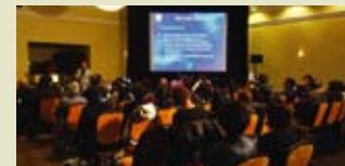
工作坊上大家都全神貫注