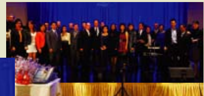
台上一眾當地領導分銷商