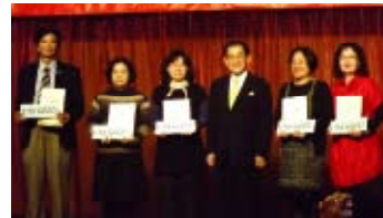
Distributors awarded on stage. 台上接受獎章的分銷商