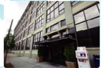
⑤ New York (紐約)