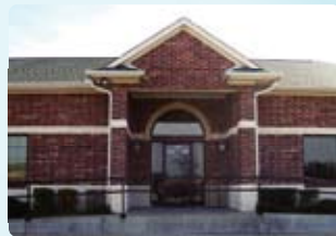
③ Texas (德州)