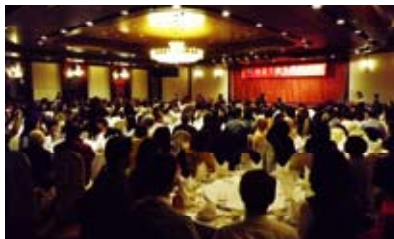
The venue was filled with many people. 會場都是出席之賓客