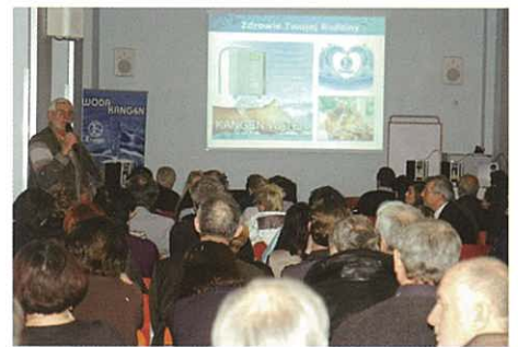
The venue in Warsaw 華沙之會場

於12月14日華沙舉行了演講會，整個會場都擠滿了參加者。現在作為東歐之波蘭也要開始推展Enagic事業了。