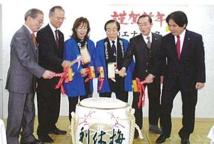
The party began with the Japanese traditional Kagamiwari. 在日本傳統活動後開始了懇親會