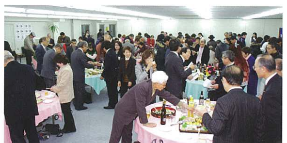
There was a friendly atmosphere throughout the party. 懇親會在一片熱鬧中進行