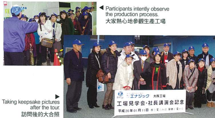
Participants intently observe the production process. 大家熱心地參觀生產工場