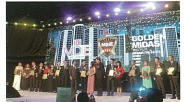
The glamorous Golden Midas Award Ceremony 華麗之Golden Midas頒獎儀式