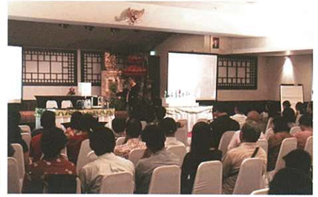
The venue in Bali Island 峇里島會場