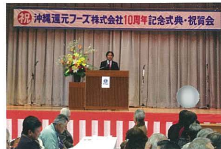
正發表祝辭之大城博成會長