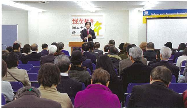
The hall on the 2nd floor of the factory was completely full of people. 滿坐的2樓會場