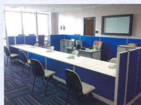
Kantor Counter 櫃檯