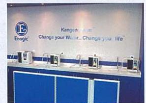
Our display of Enagic merchandise. Tempat penempatan mesin / contoh mesin 製品陳列展台