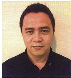
Iskandar Mirza (6A) イスカンダル・ミルザ