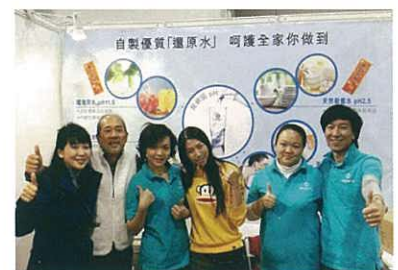
The sponsors of this event 主辦之分銷商