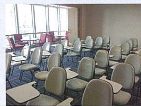
Ada ruang seminar dan resepsionis. The seminar room (front) and Enagic salon (back left). 會議室(前)及大堂(後)