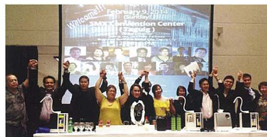
Our leading Filipino distributors 菲律賓之有力分銷商非常團結

We have never had such a large-scaled event, and all the distributors commemorated the occasion and pledged to unite their efforts for future success.