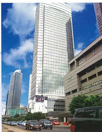
Office berada di gedung lantai 22. Our Indonesia office is located on the 22nd floor of this building. 辦公室位於大樓的22樓