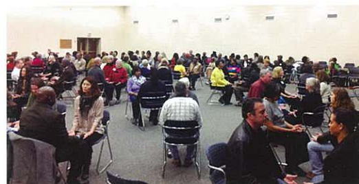
A sneak peek of the training. 培訓的一刻

The Atlanta training (January 25) was held in the auditorium of Atlanta Technical College. In what other country can you find such a generous university to offer training space to MLM companies?