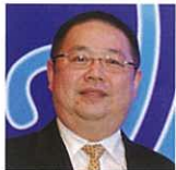
Tan Tjong king