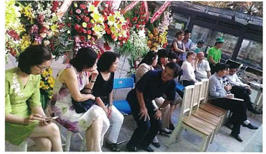
Many gathered to celebrate the opening. 一眾嘉賓前來慶祝開幕