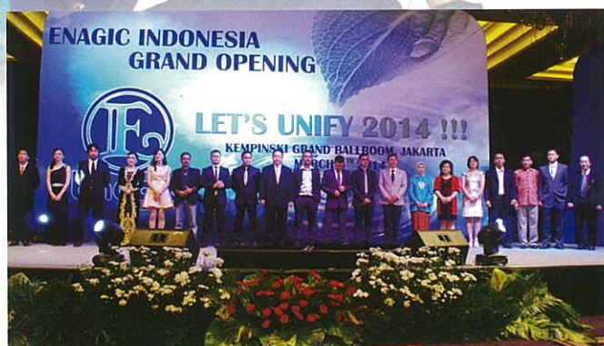
Local leading distributors meet together 當地頂級分銷商聚首一堂