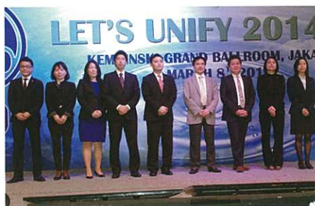
Main staff from other Asian branches being introduced 亞洲各國主要職員