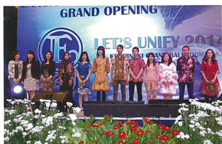
Staff being introduced 介紹分店職員