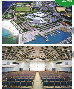
Okinawa Convention Center 沖繩會議中心