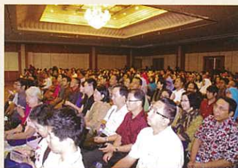
Audience listening intently 認真地聆聽之參加者