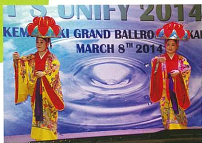
Ryukyu Dance / 琉球舞蹈