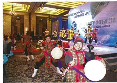
Eisa (Okinawan traditional dance) / 沖繩盆舞