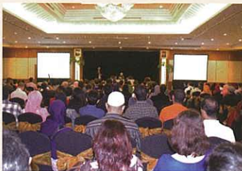
Hall filled with excitement 充滿熱誠之演講會場