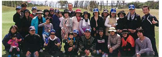
Members of the Ishii group enjoying the long walk. 石井團隊於瀨嵩CC散步

On March 11th, Ishii group members set out on a long walk through the Enagic Sedake CC 18-hole course in Nago city.