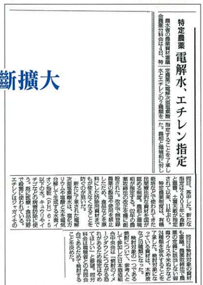
農藥指定之報到「日本農業新聞」3月5日