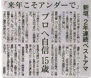
「琉球新報」上報導了新垣選手之近況