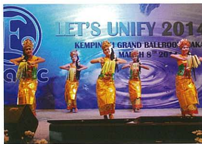
Balinese Dance / 峇里舞