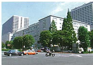
把酸性水定為指定農藥之農水省

就此，加入醫療·食品分野類別，作為病害除防之活用而不斷擴大。最初由日本電解水協會(JEWA)之加盟各社，以及關連企業之長年之努力終於得到回報。大家也向各界把這重要情報傳播開去吧。