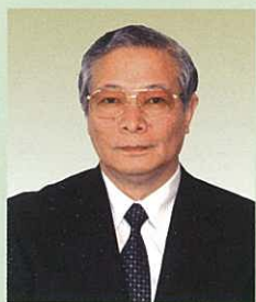
東京中央齒科· 植入中心院長 醫學博士