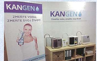
Kangen office in Bratislava, Slovakia. 斯洛伐克之還原水店