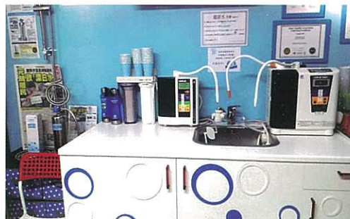
以水色作為基調的還原水店