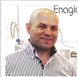
★Slovakia / 斯洛伐克 Kirov Panyat キロブ・パニヤト(6A)

His business principle is clear: "having good relations and mutual satisfaction establishes a win-win business" and having Kangen offices helps in doing just that.