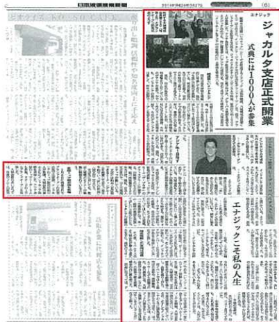
「日本流通產業新聞」3月27日版面