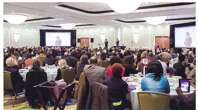
The venue was filled with many people. 會場充滿了參加者