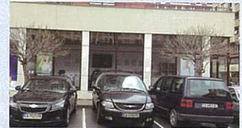
Kangen office in Sofia, Bulgaria. 保加利亞之還原水店