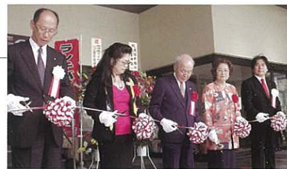
於剪綵儀式上大城博成會長(最右)及有關人士(右2為「溫泉Aroma」第100萬位客人)