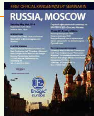
預告說明會之海報

在人口有1.5億之巨大市場莫斯科，Enagic終於開始進入。事業說明會預定於5月底，下期會有詳細報導。