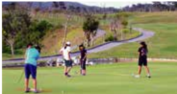
正練習推桿的學員們

這裡不單有練習場，還有18洞全球道，讓學員每日都可作不同練習。參觀當日也可看到男女學員在球道上練習推桿。