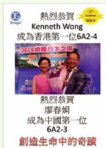
A poster made to celebrate the couple's achievements.