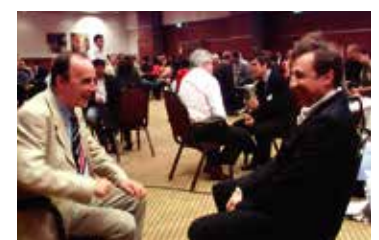
There was a friendly atmosphere at the training session in Amsterdam 培訓的氣氛非常平和(阿姆斯特丹會場)