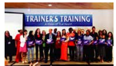
"The graduates" of our very first training course session in LA 第一屆之一眾「畢業生」(羅省會場)

大城博成會長更出席了於15日的「結業禮」，並把培訓員扣針跟認定書交予所有學員。得到認定之分銷商都對感到非常高興。