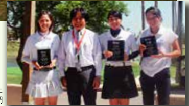
大城會長獎勵在當地大會上取得1~3位之學員們