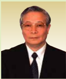
東京中央齒科・ 植入中心院長 醫學博士