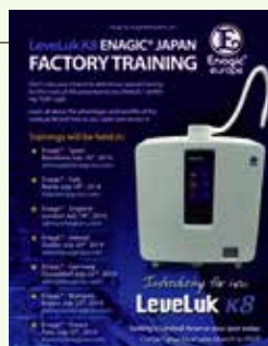
Poster for the upcoming Training in EU EU之培訓宣傳海報