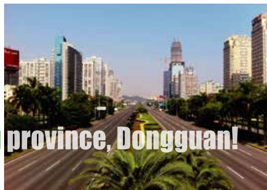
The rapidly growing urban district of Dongguan 高速發展的東莞市區