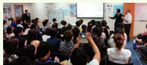
KANGEN8 presentation held in Hong Kong 香港分店的KANGEN8說明會