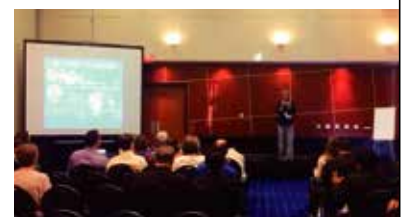
A glimpse of the Vancouver workshop. 溫哥華的研習會會場

拿大的溫哥華也有多人出席進行研習。技巧不提升的話Enagic事業是不會成功的，所以有機會的話請大家也積極參加研習會。