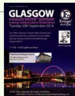
Poster for the Glasgow seminar 格拉斯哥之培訓宣傳海報

In September, we also have the "Dynamic Personal Training" scheduled in London on the 27th and a seminar set on the 30th in the city of Glasgow, Scotland.