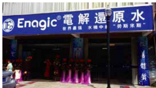
The newly opened Kangen Office 還原水店之開幕