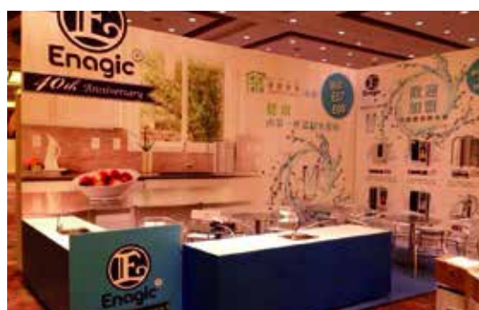
The spacious exhibition booth 廣闊之展示攤位

於8月22日到24日，澳門分銷商及Olive團隊於家居綜合展覽會上，開設了攤位介紹還原水機及還原水之好處，很多訪客也對此表示很有興趣，完成了一個非常有意義的展覽。