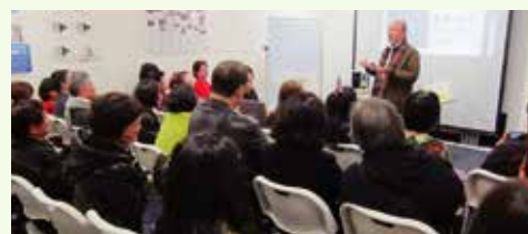
Seminar held in Australia / 澳洲演講會