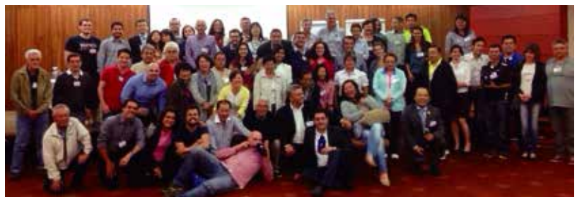
Participants of the Sao Paulo training workshop gathered for a picture. 一眾參與聖保羅研習會的分銷商

Enagic正在各地派遣了訓練員為講師作出培訓。8月30日在巴西的聖保羅便有60人出席了培訓。9月7日在加