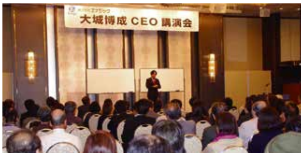
The hotel hall packed with participants. 酒店之大會場坐無虛席