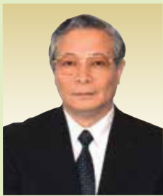
東京中央齒科・ 植入中心院長 醫學博士