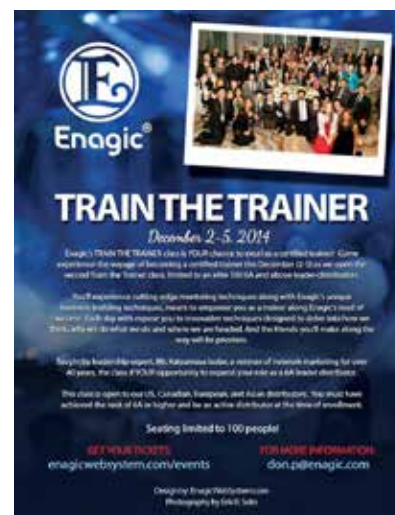
A 4-day training session for trainers scheduled in December. 12月連續4日舉辦之培訓員培訓海報