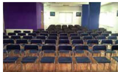
Spacious seminar room of the training center. 培訓中心內之廣闊演講廳

EU各國都活躍地向分銷商提供培訓。繼首都布加勒斯特之第2都市布拉索夫開設培訓中心1週年之羅馬尼亞，舉行了盛大紀念之培訓及派對。Enagic事業於東歐同樣順利地不斷發展。