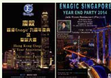
Event poster for Hong Kong (left) and Singapore. 香港(左)跟新加坡之活動海報

12月各國都在計畫不同之慶祝活動。其中香港「忘年會」(12月16日)，大城博成會長都預定出席，非常注目，下期會作詳細介紹。