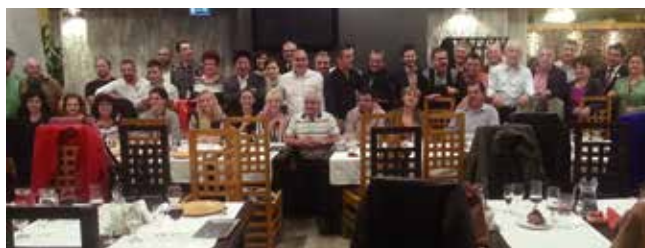
Local distributors celebrating the 1-year anniversary. 興奮地慶祝1週年之當地分銷商