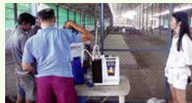
Super 501 prepared for the experiment. 實驗用之Super501

在岩手縣之養雞場也有個案發現飲用還原水之雞隻能加快成長。所以讓人非常期待今次乳牛之結果。