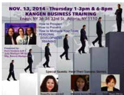
Flyer for the New York training session. 紐約之培訓之宣傳海報

美國同樣分銷商之培訓遍地開花。11月於亞利桑那、紐約、加里福尼亞都有舉辦。其中12月2至5日連續地為預定6A(以上)而舉辦之「培訓員培訓」為最高級別，得到很大注目。