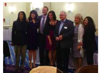
Many distributors celebrated the 10-year anniversary. 一眾分銷商前來10週年典禮