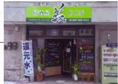
放有「還原水」直幅之「義GIN」

住 所 ■ 沖繩県那覇市鏡原町3-7 電 話 ■ 098-858-3523 營業時間 ■ 星期一~四、日 中午6時~零晨1時 星期五、六、公眾假期 中午5時~零晨1時 休 息 日 ■ 不定期