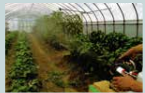
於會議上發表了香川縣之農家溫室內進行之酸性電解水試驗