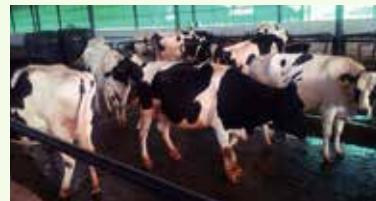
How fast will the cows grow? 乳牛們會長得多快呢？