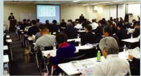
會有超過100人以上出席

JEWA於本年8月，取得了法人資格(一般社團法人)。電解水於今後之不同用途方面，讓人十分之期望。