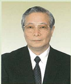
東京中央齒科・ 植入中心院長 醫學博士