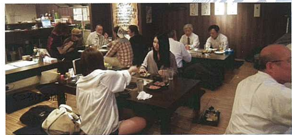
可容納40人之寬敞店內

有食材之味道，強還原水則全面強化了衛生管 理。湯類、味噌湯、味汁、做飯、調酒用水、 清洗食材等都因為使用還原水而得到很好效 果。再者，由於店內使用了很多油作烹調，強 還原水於去油方面非常有效。