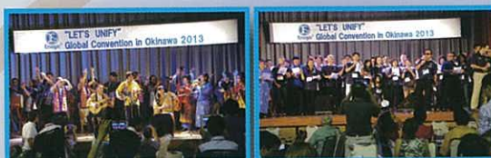
2013 Enagic Global Convention