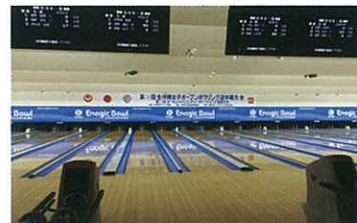
The bowling alley is equipped with 36 lanes. 保齡球館設有 36 條球道