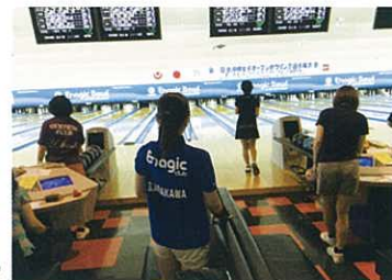
Enagic Club member who competed in the “All Japan Club” Bowling Championship. 於全日本俱樂部對抗選手權出場之 Enagic 俱樂部選手