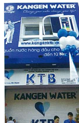
The 2-story Kangen shop, "KTB" 樓高2層的還原店 "KTB"

最近，於胡志明志的大街上開設了名為「KTB」的還原水店。負責人 Tuong Thuy Vu 先生跟團隊合力開設之還原店，將會成為當地 Enagic 事業之據點。