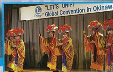
2014 Enagic Global Convention