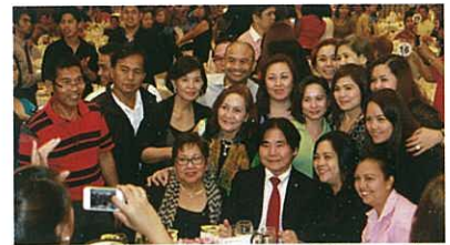
Many requested pictures with the CEO – a familiar scene at our events 大城會長跟一眾分銷商合照-熟悉的光景