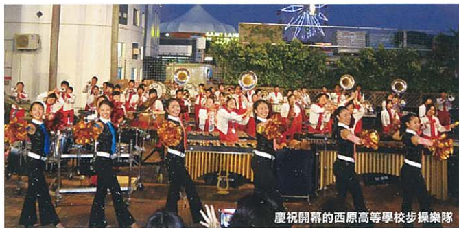
慶祝開幕的西原高等學校步操樂隊

3月1日上午, Enagic美浜保齡球館(沖繩縣中頭郡北谷町美浜)終於正式隆重開幕。