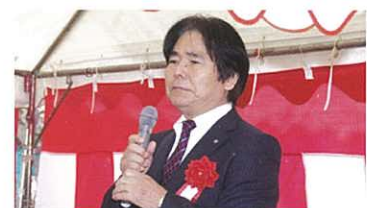
Mr. Ohshiro shares his aspiration for the Country Club. 大城會長分享他的熱切期望