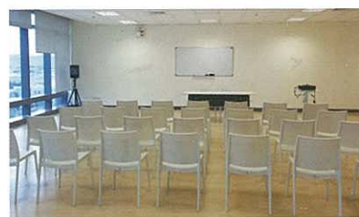
The spacious seminar room 廣闊的演講室