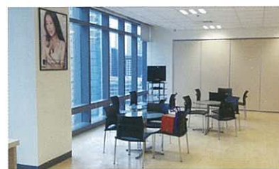
The salon with pleasant atmosphere 明亮的氣氛講談室