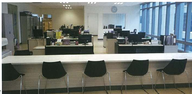
12 employees work in the office section 供12名員工工作的辦公室