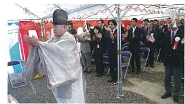
The special groundbreaking celebration 盛大之動土儀式