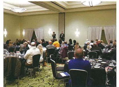
The restaurant was filled with participants. 滿坐之會場餐廳

在美國南部已很久沒有舉行演講會上，大城會長向大家提到了於6月在加里福尼亞州舉行的環球會議，並叫出今年之目標：「達成每月20,000台。」