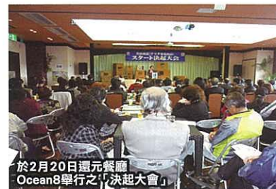
於2月20日選元餐廳 Ocean8舉行之「決起大會」