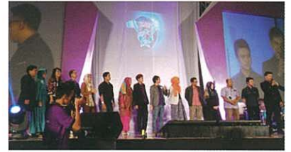
Local leading distributors were introduced on stage. 台上介紹了當地有力分銷商