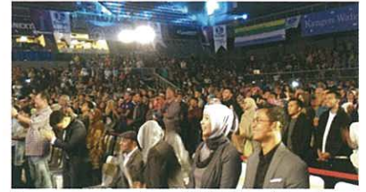
The venue was packed with 3,000 participants. 坐滿3000人之會場