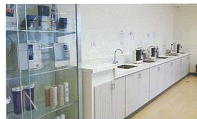
Leveluks on display, ready for anyone to try 供實際使用之還原水機及展覽櫃