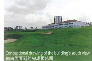
Conceptual drawing of the building's south view 由南面看到的完成預想圖

俱樂部大樓共有2層，面積為3,085平方米，更附設能一覽大浦灣美景之頂級客房。2樓設有餐廳及浴室。大城會長在動土儀式上說：「期望世界中之人們也能輕鬆享用大樓內之設施。」