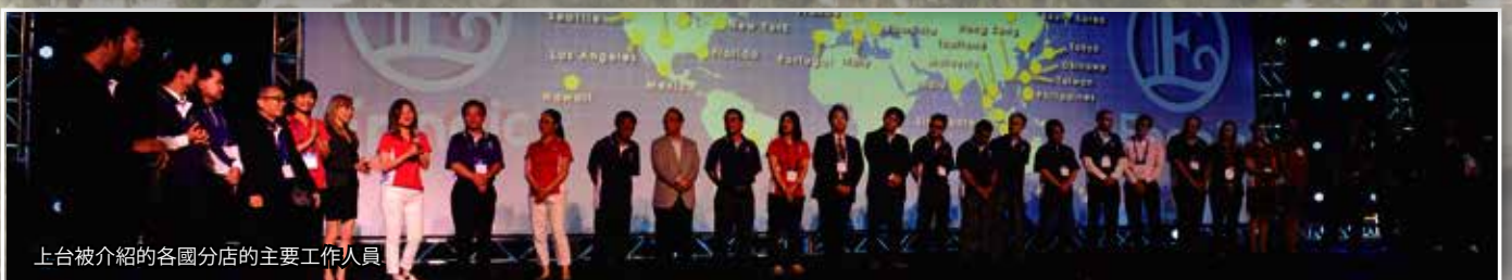
上台被介紹的各國分店的主要工作人員