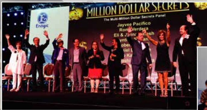
獲得「百萬分銷商」稱號的6A2-3(以上)超級分銷商

在7月27日的分銷商培訓認定講師一個接著一個上台，說明分銷商活動時，必要的心理準備和理念，全力以赴的態度等，以各自的立場，給予建議。另外，中場令人嚮往的新舊「百萬分銷商」也上台介紹，會場氣氛達到高潮。