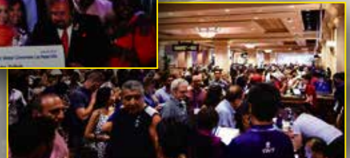
繁忙的接待區處理理想登記人們