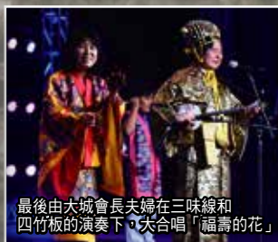
最後由大城會長夫婦在三味線和四竹板的演奏下，大合唱「福壽的花」