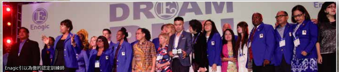
Enagic引以為傲的認定訓練師