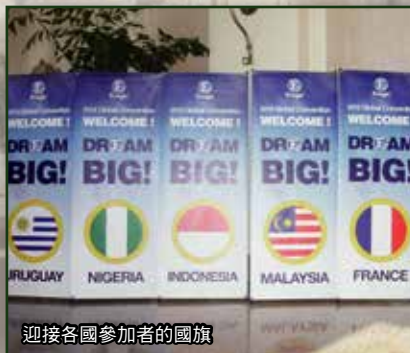
迎接各國參加者的國旗