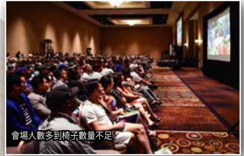
會場人數多到椅子數量不足

在6月28日大會前，在Mandalay Bay Hotel裡，26日舉行「Global 6A Training」和「Business Seminar」，27日舉行「Distributor Training」。不管是哪個活動，都是在世界上拓展Enagic事業，受認定的講師在擔任，有非常多的參加者認真的聽著。