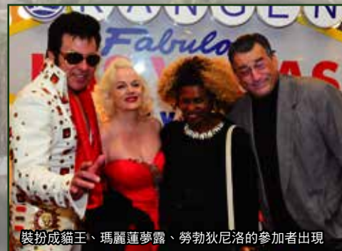
裝扮成貓王、瑪麗蓮夢露、勞勃狄尼洛的參加者出現