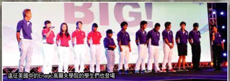
遠征美國中的Enagic高爾夫學院的學生們也登場