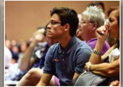
認真地聽著講師的話的參加者