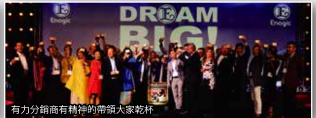
有力分銷商有精神的帶領大家乾杯