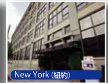
New York (紐約)