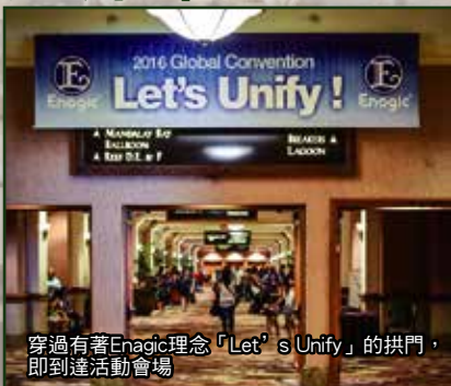
穿過有著Enagic理念「Let's Unify」的拱門，即到達活動會場