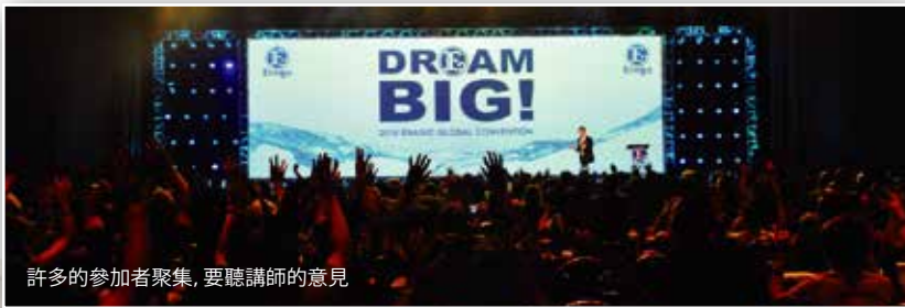
許多的參加者聚集, 要聽講師的意見