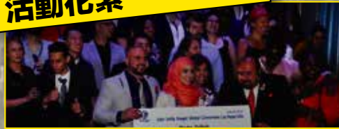
慶祝夥伴升格，拍攝紀念照片的分銷商團體