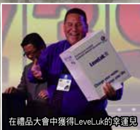
在禮品大會中獲得LevelLuk的幸運兒