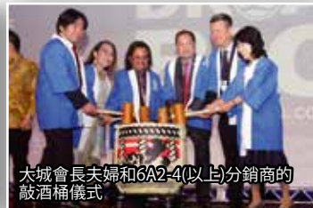
大城會長夫婦和6A2-4(以上)分銷商的敲酒桶儀式