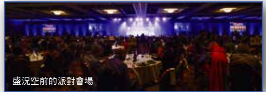
盛況空前的派對會場

在表揚典禮之後，下午5點到7點會場外有雞尾酒派對，許多人享受小酌「餐前酒」。正式的晚餐派對上，吉他、三味線、古箏帶來非常獨特的樂器三重奏所帶來的表演，為派對開場。接著大城會長開場，「非常感謝大家今天聚集在這裡，希望大家可以充分地享受今晚。讓我們大家一起把「仁愛的圈子」況展到世界各地吧!」一開場就帶來非常強力的宣言。