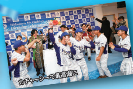
カチャーシーで最高潮に

も加わって、賑やかなカチャーシーが始まりました。最初は遠慮気味だった参加者たちも次第に熱を帯び、踊りの輪が広がって大いにヒートアップしました。