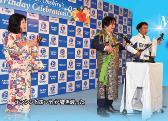
サンシンと四つ竹が響き渡った