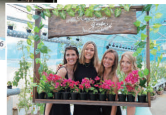
還元ガーデンで記念撮影を