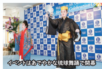
イベントはあでやかな琉球舞踊で開幕

また、かつての戦争がもたらしたマラリヤ禍で、子どもの頃の会長と家族が苦しめられたことを振り返り、戦争などない平和な世界が望ましいと強調しました。そして健康でいることの大切さを力説し、「100歳、120歳まで元気でいましょう」と参加者に呼びかけました。