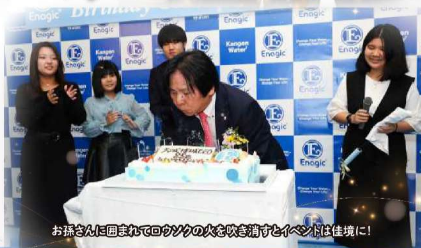
お孫さんに囲まれてロウソクの火を吹き消すとイベントは佳境に!