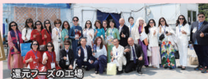
還元フーズの工場