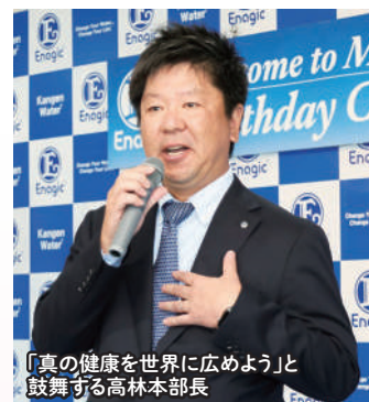
「真の健康を世界に広めよう」と 鼓舞する高林本部長