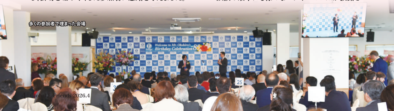
多くの参加者で埋まった会場