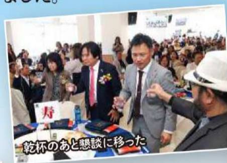
乾杯のあと懇談に移った