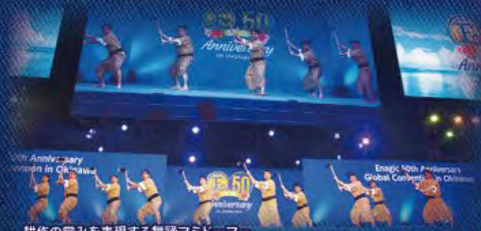
耕作の営みを表現する舞踊マミドマー