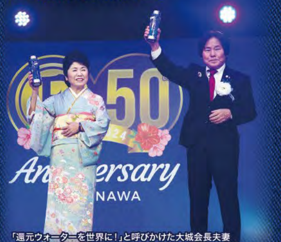
「還元ウォーターを世界に!」と呼びかけた大城会長夫妻

6A~6A2-2昇格者の認定証授与で一気にヒートアップした場内だったが、ランチタイムに入ると、国別、またはグループ別に分かれて仲良く食事を摂る光景があちこちで見られた。