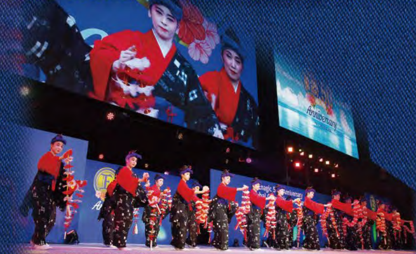
再び披露された華麗な琉球舞踊