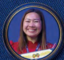
Hong Lee Meadows