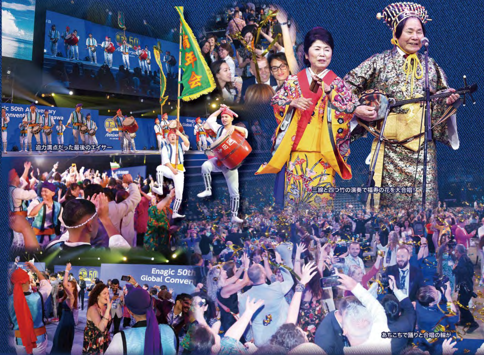
三線と四つ竹の演奏で福寿の花を大合唱！