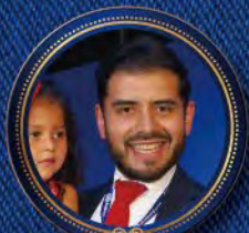
Bien Ahora S DE RL DE CV