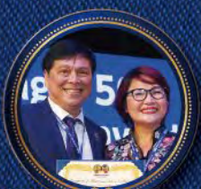
Thang Dan NGO