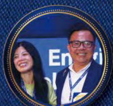
Alan Kathy LLC