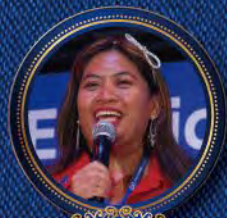
Eden Olave Online LLC