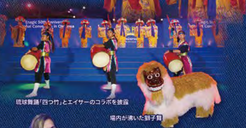
琉球舞踊「四つ竹」とエイサーのコラボを披露