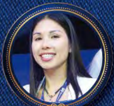
T T Kangen LLC