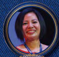
NP Healthy Water INC