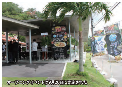
オープニングイベントは9月20日に実施された