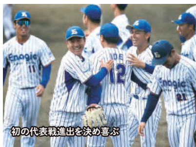
初の代表戦進出を決め喜ぶ

10月29日から11月9日までの期間、大阪の京セラドームで開催される「第49回社会人野球日本選手権大会」。これは毎年夏に東京ドームでおこなわれる「都市対抗野球大会」と並ぶ社会人野球最高峰の舞台ですが、エナジック硬式野球部があと1歩で参加できるまで迫りました。