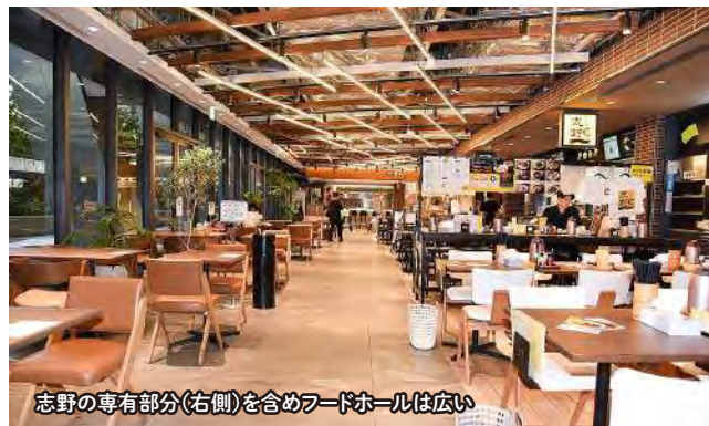
志野の専有部分(右側)を含めフードホールは広い

If you know of any unique use for electrolyzed water, we'd love to hear from you! 電解水のユニークな活用法を募集中!