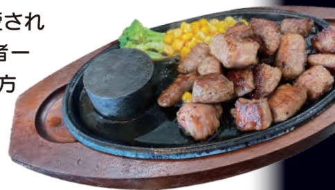
人気の 還元和牛サイコロステーキ

このE-Caféは還元和牛を提供するだけでなく、販売店の皆さんが還元水を広めるための活動拠点としての役割も担っています。もちろん、一般のお客さんにも愛される店となるよう関係者一同、努力を重ねていく方針です。