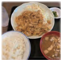
にくち 一番人気の「肉七」

住所: 東京都品川区西五反田8-4-13 JPビル1階 電話: 03-3494-4988 定休日: 年中無休 営業時間: 午前11時～午後11時 (ラストオーダー10時半)