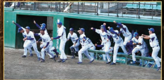
スポーツフラッシュ:10P 硬式野球部、あと1歩で全国大会へ!