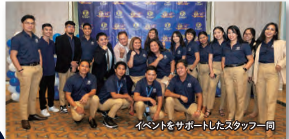
イベントをサポートしたスタッフ一同