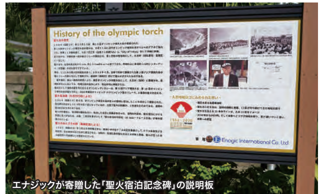
エナジックが寄贈した「聖火宿泊記念碑」の説明板

レースは嘉陽区の宿泊記念碑前を出発点に、二見地区内で折り返すコースでおこなわれ、今年は18歳以上