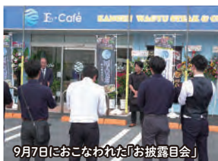
9月7日におこなわれた「お披露目会」