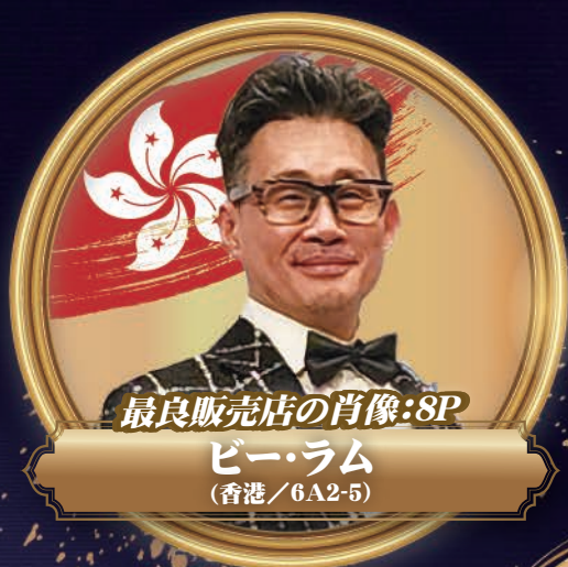
最良販売店の肖像:8P

「真の健康」「情けの和」を 伝え続けて24年！ 300号達成を機によりいっそう 読者の皆さんのお役に立つ 誌面作りに励みます。(編集部)