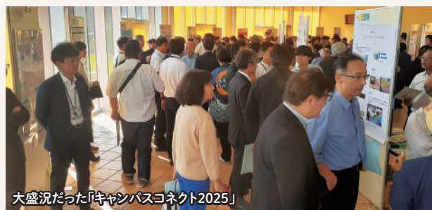
大盛況だった「キャンパスコネクト2025」