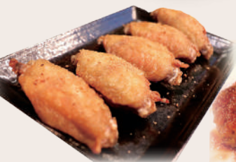
自慢の手羽先5本セット

住 所: 東京都江東区牡丹3-12-8 小瀧ビル1F 電 話: 03-3820-2654 定 休 日: 不定期(主に月曜) 営業時間: 午前11時～午後11時