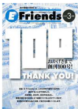
100号達成記念号 (2009年3月号表紙)

本誌は元々、『E-Friends』という名称で、2001年8月に4ページ立て2色刷りで創刊されました。その後、8Pから12P