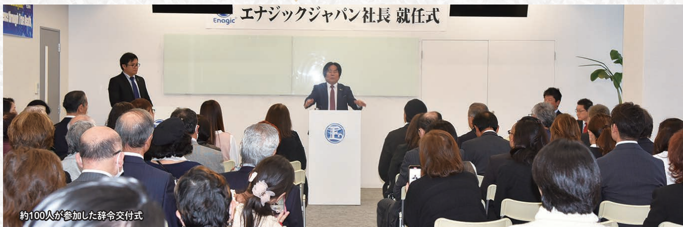
約100人が参加した辞令交付式