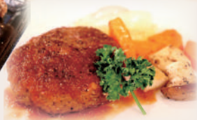
人気料理の 「石垣牛のハンバーグ」