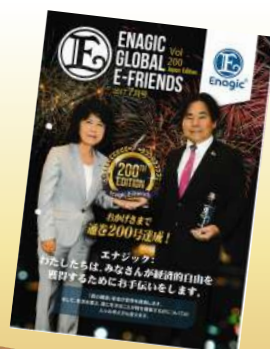
200号達成記念号 (2017年7月号表紙)