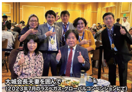
大城会長夫妻を囲んで (2023年7月のラスベガス・グローバルコンベンションにて)